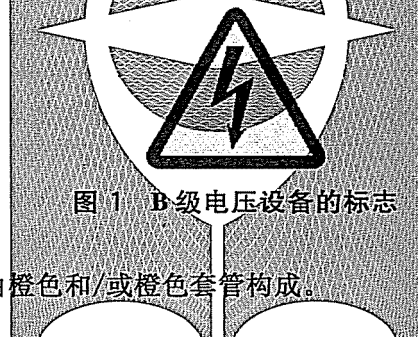
图 1 B 级电压设备的标志

在接近 B 级电压源,如燃料电池电堆、电池、超级电容等的附近应标示图 1 所示的标志。如果移动覆盖物或外壳,使 B 级电路的带电部件和/或基本绝缘暴露时,则在覆盖物或外壳上应有该标志。