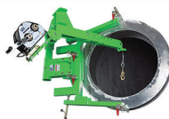
侧边进入系统 （水平方向）