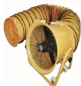
大功率机械通风设备