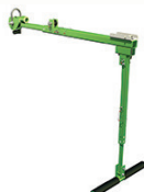
便携式吊杆系统 （水平/垂直方向）