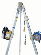
三脚架救援系统 （垂直方向）