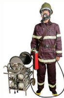
高压送风式长管呼吸器