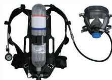
正压式空气呼吸器